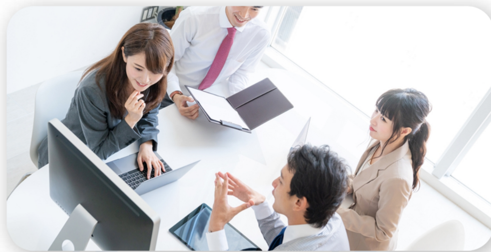
驚きの高品質と使いやすさ