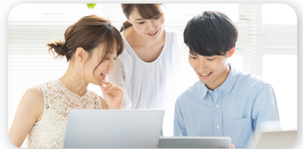
40分時間制限の撤廃