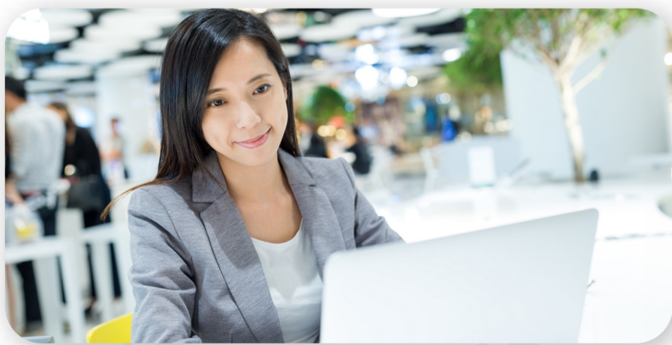
在宅勤務者との打ち合わせもスムーズに

ストレスを感じさせない映像と音声品質、ユーザーのリテラシーに依存しない操作性を実現。 ぜひ、Zoom Meetings（有償版）を体感ください。